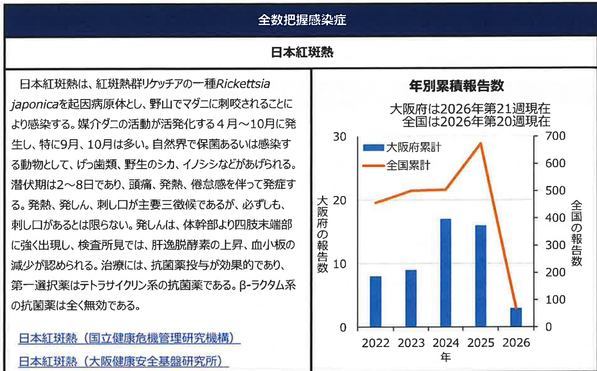
表2. 大阪府全数報告数 (2026年 第21週5月18日～5月24日)

～日本紅斑熱～ 大阪府では2025年16例の報告があった。2026年は第21週時点で3例の報告がある