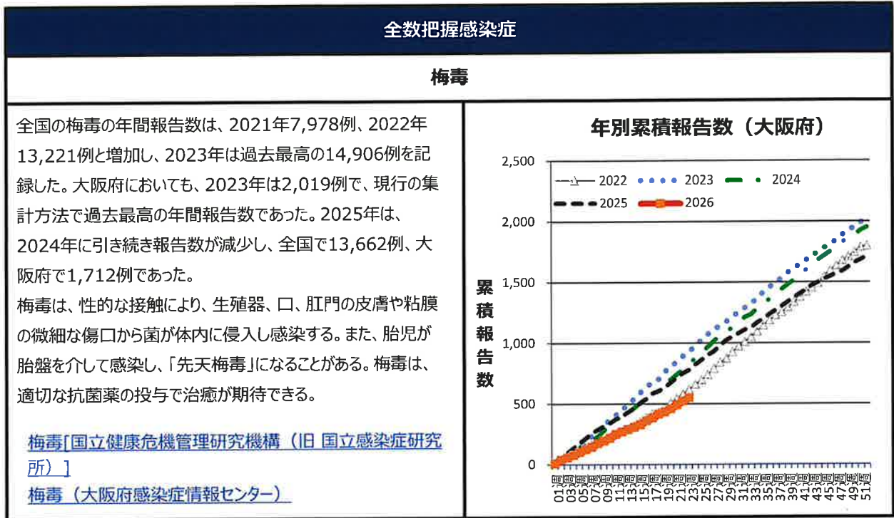
表2. 大阪府全数報告数（2026年 第23週6月1日～6月7日）

注意：この週報は速報性を重視しておりますので、今後の調査に応じて若干の変更が生じることがあります （報告があった疾患のみ記載しています。詳細は感染症情報センターホームページ＞【週報】＞全数把握疾患 をご覧ください。）